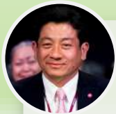
Dr. Suwit Khunkitti

"Ecosystem of non-clinical and clinical research in Thailand"